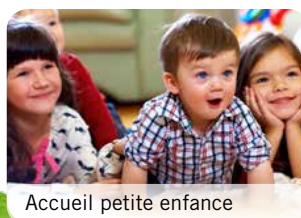
Accueil petite enfance