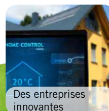
Des entreprises innovantes