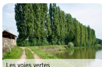
Les voies vertes