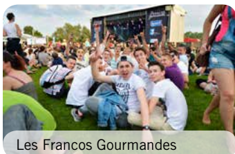
Les Francos Gourmandes