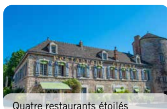
Quatre restaurants étoilés