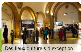
Des lieux culturels d'exception